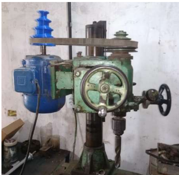
Figura 6. Polia instalada no redutor da furadeira de bancada