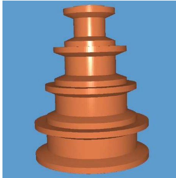
Figura 2. Representação 3D da polia em software de modelagem (O autor, 2020)