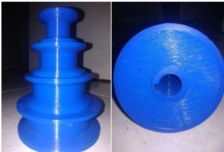
Figura 5. Polia fabricada por impressão 3D

A Figura 5 mostra a polia fabricada, na qual foi utilizado o filamento de PLA devido a sua maior resistência mecânica e melhor acabamento superficial.