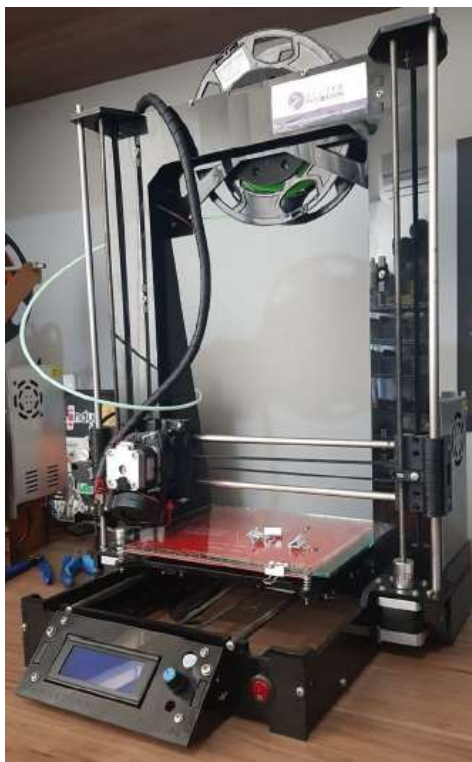
Figura 4. Impressora 3D Graber Z35 (O autor, 2020)

A Figura 5 mostra a polia fabricada, na qual foi utilizado o filamento de PLA devido a sua maior resistência mecânica e melhor acabamento superficial.