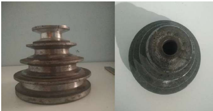
Figura 1. Polia do redutor

A polia a ser fabricada para reposição foi uma polia escalonada de aro abaulado, mostrada na mostra a fig. 1. Tal componente pertence a um redutor de uma furadeira de bancada.