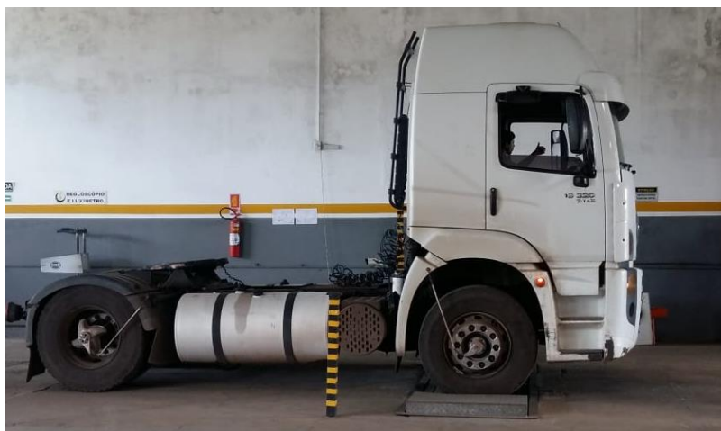
Figura 6: Teste de freio no eixo dianteiro.

O paquímetro é um instrumento usado para determinar com exatidão as dimensões de pequenos objetos. É uma régua graduada, que possui encosto fixo e sobre ela desliza um cursor. Possui dois bicos para medir, o fixo ligado à escala e o móvel ao cursor (RÉGUA ONLINE, 2012).