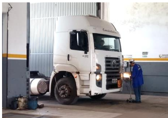
Figura 2: Inspeção no farol esquerdo.

Opacímetro é o instrumento que realiza medição da opacidade da fumaça expulsa pelo escapamento dos motores com ciclo Diesel. A análise é feita através da absorção da luz. É constituído de uma câmara de medição, que possui instalado um emissor e um receptor de luz (fotocélula) (SENAI, 2002). Na Fig. 3 está representado um opacímetro tipo sonda utilizado em análise de opacidade em veículo Diesel.