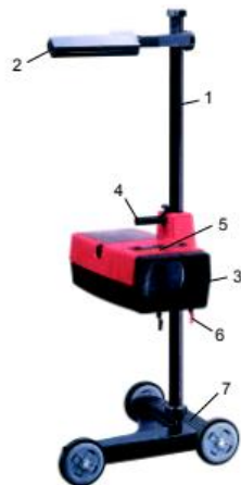
Figura 1: Regloscópio.

O regloscópio é o equipamento empregado para verificação e constatação da existência e definição do limite claro-escuro e do ajuste vertical da inclinação, alinhamento e intensidade que o feixe de luz dos faróis baixo, alto, de neblina e longo alcance apresentam (SENAI, 2002). Na Fig. 1 está a representação dos itens que o constituem.