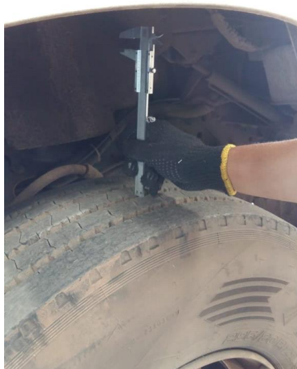
Figura 7: Medição dos sulcos.