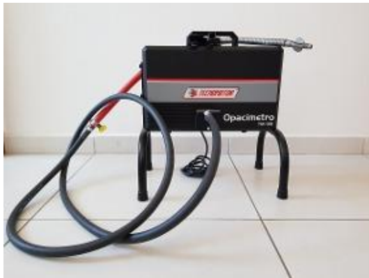
Figura 3: Opacímetro tipo sonda.

Um opacímetro tipo sonda é inserido no escapamento para análise dos níveis de CO, CO 2 , HC e o fator de diluição, para em seguida, comparar com os limites que aprovam o veículo. O exame é realizado em dois momentos, em rotação em marcha lenta e com a rotação máxima em 2500 RPM. A Erro! Fonte de referência não encontrada. 4 demonstra como acontece a análise de opacidade.