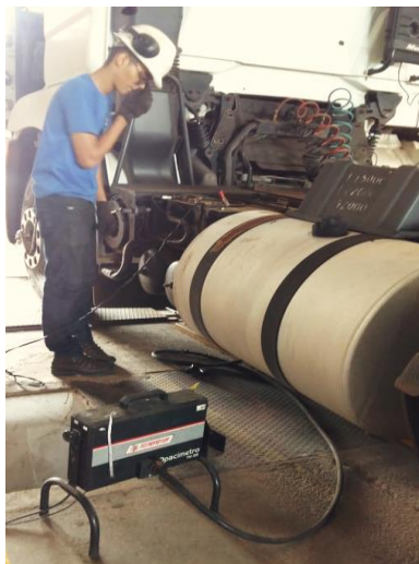
Figura 4: Teste de opacidade.

O frenômetro de rolos é utilizado em inspeções veiculares para a análise da força e deficiência da frenagem por roda de cada eixo e a eficiência total de frenagem do veículo e desequilíbrio de frenagem por eixo. Esta verificação é aplicada em freio de serviço de veículos leves, pesados e motocicletas. A força e eficiência do freio de serviço de estacionamento (freio de mão) também é inspecionado (SENAI, 2002). Na Fig. 5 está a representação do funcionamento de um modelo convencional de frenômetro.